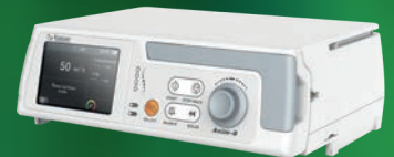
Anim - 8