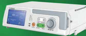
Erch - 6